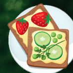
ПОЛЕЗНЫЙ БУТЕРБРОД >>>